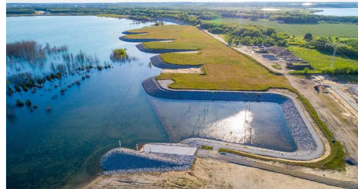
Ausbau Sedlitzer Bucht