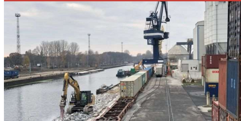
Ladegleis Königs Wusterhausen