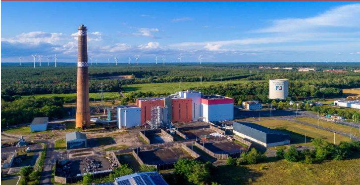
Dekarbonisierung der Wärmeversorgung Senftenberg