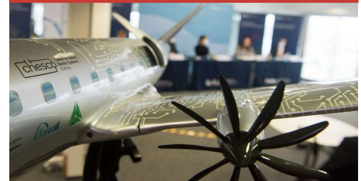
CHESCO – Zentrum für hybridelektrisches Fliegen